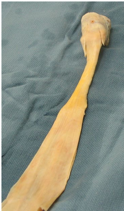
Sener Død donor