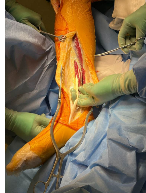
Riksen og Ullevål