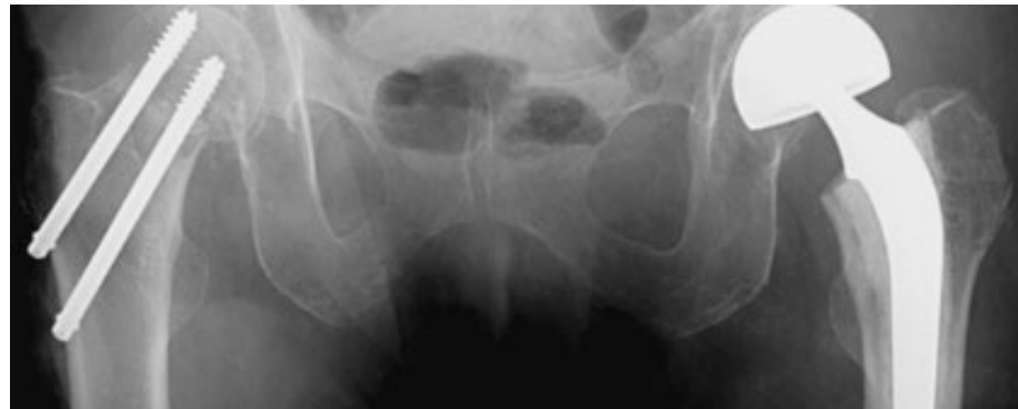
Bein Levende donor